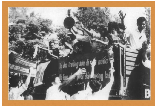
Học sinh Hà Nội phấn khởi trước lúc lên đường gia nhập lực lượng TNXP hưởng ứng phong trào “3 sẵn sàng”.

Ngày 21/6/1965, Thủ tướng Chính phủ ra Chỉ thị số 71/TTg-CN giao cho Trung ương Đoàn Thanh niên Lao động Việt Nam (sau này là Đoàn TNCS Hồ Chí Minh) tổ chức các Đội Thanh niên Xung phong chống Mỹ cứu nước tập trung phục vụ công tác giao thông vận tải. Từ đây, các Đội Thanh niên Xung phong chống Mỹ cứu nước được thành lập nhanh chóng theo yêu cầu của cuộc kháng chiến. Với quyết tâm “Xẻ dọc Trường Sơn đi cứu nước”, “Tất cả để đánh thắng giặc Mỹ xâm lược”, đã có trên 14 vạn cán bộ, đội viên thanh niên xung phong tình nguyện tham gia 170 Đội Thanh niên Xung phong và 50 đại đội Thanh niên Xung phong trực thuộc ở miền Bắc; 5.000 cán bộ, đội viên thanh niên xung phong tập trung và 35.000 cán bộ đội viên thanh niên xung phong cơ sở ở miền Nam.