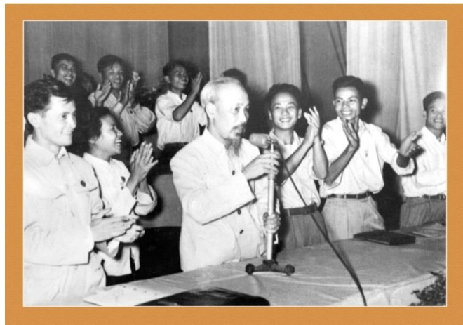
Chủ tịch Hồ Chí Minh huấn thị tại Đại hội đại biểu toàn quốc Đoàn TNLD Việt Nam lần thứ II (11/1956), tại Nhà Hát lớn Hà Nội.

Từ năm 1925, trong tác phẩm Đường Kách mệnh, Hồ Chí Minh đặt vấn đề phải xây dựng một tổ chức thanh niên cộng sản ở Việt Nam. Sau một thời gian do Người trực tiếp chuẩn bị và đề nghị với Trung ương Đảng, ngày 26-3-1931, Thanh niên Cộng sản Đoàn ra đời. Đó là thời điểm mang nhiều ý nghĩa đặc biệt trong phong trào thanh niên yêu nước theo xu hướng tiến bộ ở nước ta.