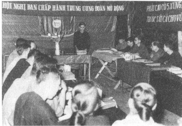
Hội nghị BCH TW Đoàn TNND Cách mạng Việt Nam mở rộng phát động phong trào “5 xung phong”, năm 1965.

Trong suốt chiều dài lịch sử của dân tộc, thanh niên nước ta từ thế hệ này đến thế hệ khác đã luôn nêu cao tinh thần yêu nước, không ngại gian khổ, hy sinh, sẵn sàng dâng thân vì sự nghiệp dựng nước và giữ nước. Trong những năm tháng chiến tranh, hàng triệu thanh niên Việt Nam đã xung phong ra trận với khát vọng hòa bình, độc lập và tinh thần “quyết tử cho Tổ quốc quyết sinh”. Những phong trào “Ba sẵn sàng”, “Năm xung phong” đã trở thành những ngọn đuốc soi đường cho nhiều thế hệ thanh niên Việt Nam xả thân cống hiến vì đất nước. Trong thời kỳ tái thiết đất nước sau chiến tranh và thời kỳ đổi mới, tiếp nối truyền thống cha anh, các thế hệ thanh niên với trái tim cháy bỏng nhiệt huyết, với bàn tay, khối óc và tinh thần tình nguyện đã hăng hái đến với vùng biên giới, hải đảo, đến với các công trình lớn của đất nước, cống hiến tuổi thanh xuân cho sự nghiệp xây dựng và bảo vệ Tổ quốc Việt Nam xã hội chủ nghĩa.